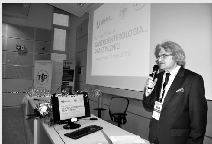
„Gastroenterologia... praktycznie!” w AJD

nych programów kształcenia i praktyk zawodowych dla przyszłych studentów.