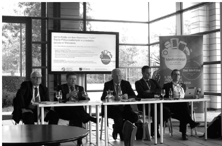
Podczas jednego z warsztatów w Lipsku