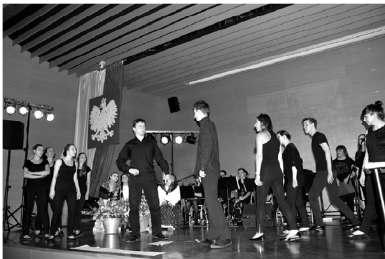
Przedstawienie studentów Instytutu Muzyki

– Spektakl podobał się publiczności, a była to przecież