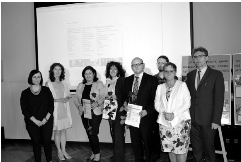
Uczestnicy konferencji o Różewiczu