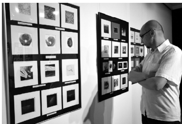
Na wystawie w „Gaude Mater”