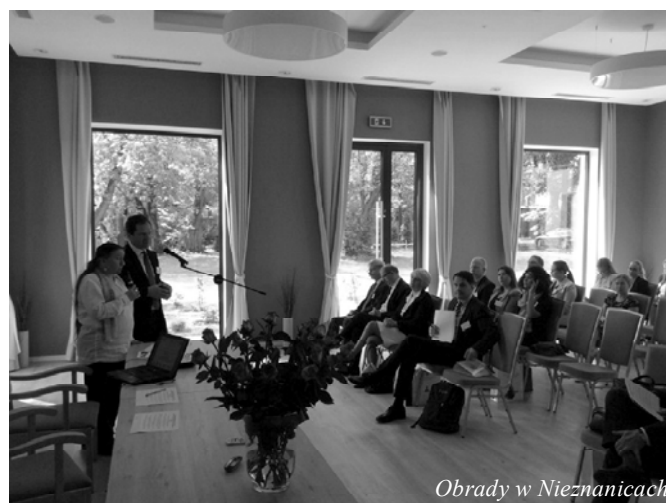
Obrady w Nieznanicach