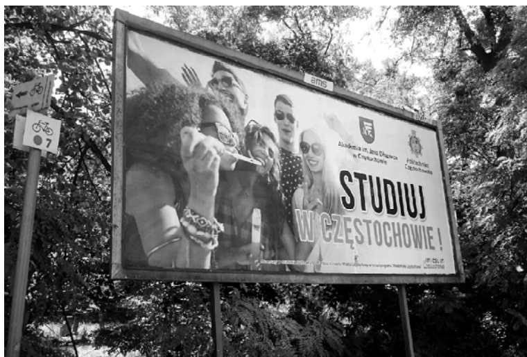
Bilbord w Kluczborku