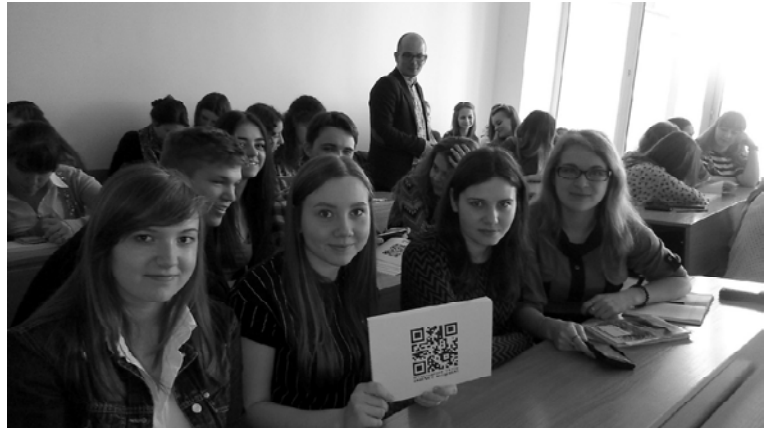
Studenci z Ukrainy