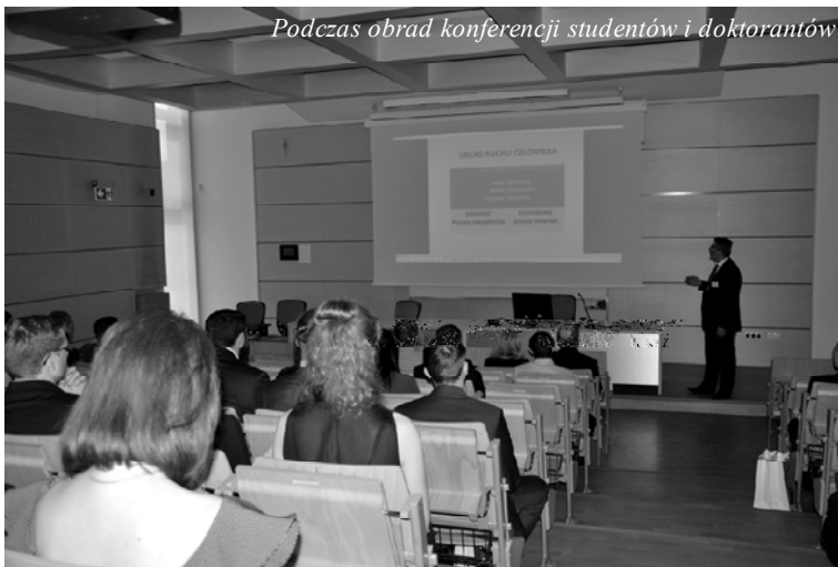
Podczas obrad konferencji studentów i doktorantów

Książka streszczeń, program i więcej informacji o konferencji na stronie http://www.physactiv.ajd.czest.pl/tkd/