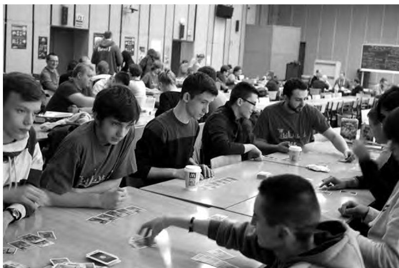
Sympatycy planszówek i karcianek podczas IX Twierdzy