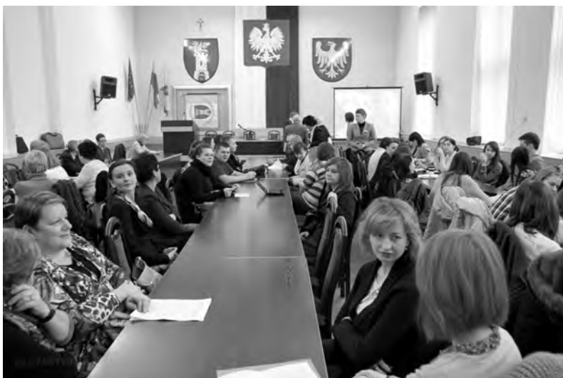
Uczestnicy konferencji