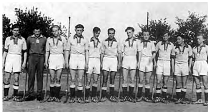
Hokeiœci na trawie AZS (I liga–1956), fot.: arch.