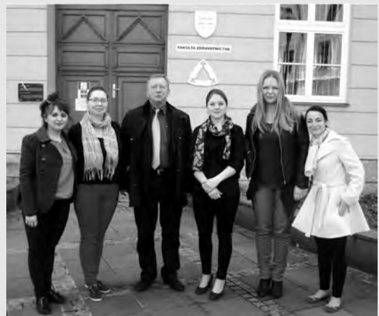
Przedstawiciele AJD na konkursie muzycznym w Rużomberku

Kolejny raz nasi studenci są zauważani i nagradzani przez międzynarodowe jury konkursu w Rużomberku. Młodym Artystom oraz ich Pedagogom serdecznie gratulujemy i życzymy dalszych sukcesów!