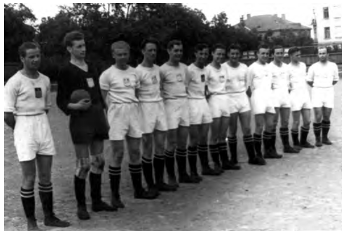
Szcypiorniaxi (1948)