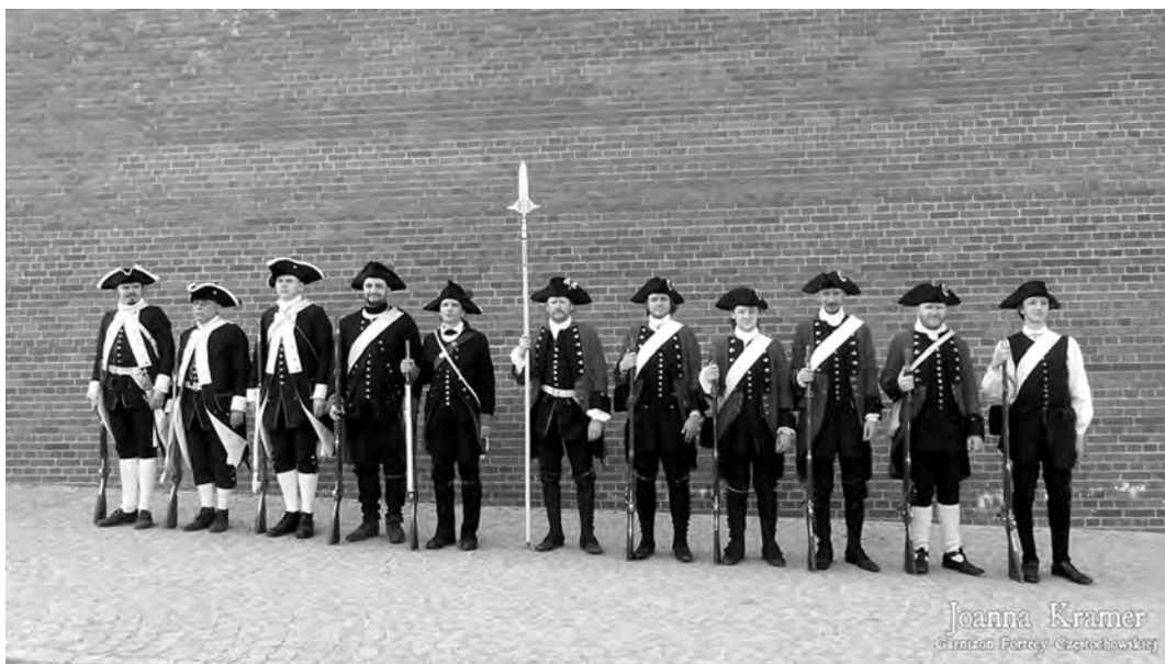
Uczestnicy biwaku historycznego

Pozanaukowym celem spotkania było rozbudzenie wśród młodzieży zainteresowania historią, a zwłaszcza małym znanym okresem XVIII wieku. W związku z tym zaplanowano imprezę towarzyszącą – inscenizację biwaku