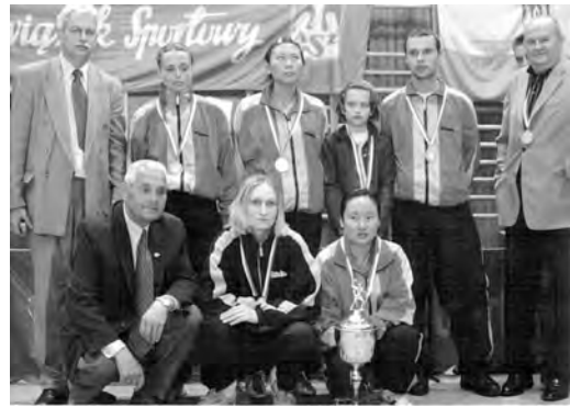
Wicemistrzyni Polski w tenisie sto 3 owym (2005)