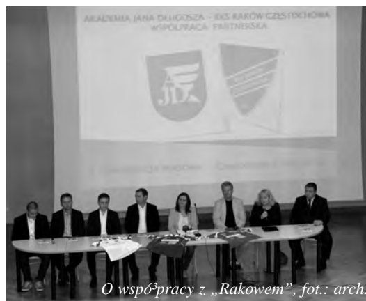
O współpracy z „Rakowem”