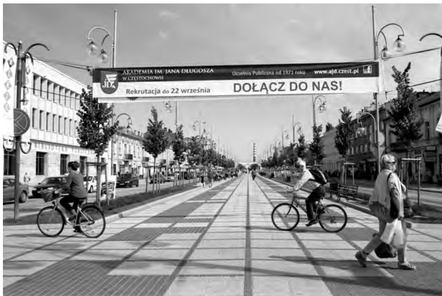
Z reklam nowych kierunków docieramy do kandydatów

Absolwent legitymuje się poszerzoną wiedzą psychologiczną i umiejętnościami umożliwiającymi mu podjęcie pracy w roli managera, lidera firmy, projektanta szeroko rozumianej aktywności społecznej, pracownika public relations (rzecznik prasowy, pracownik biur poselskich i senatorskich, urzędów publicznych, doradca w placówkach oświatowych, kulturalnych, wydawnictwach), ale również działu promocji, czy pracownika agencji reklamowej.