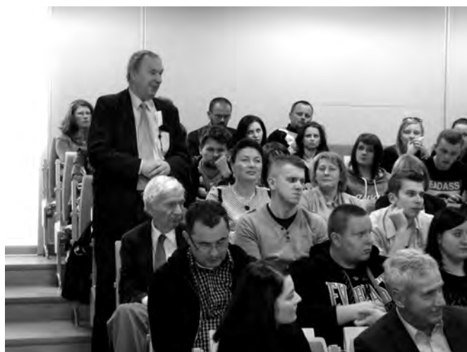
Na spotkaniu z humboldczykami