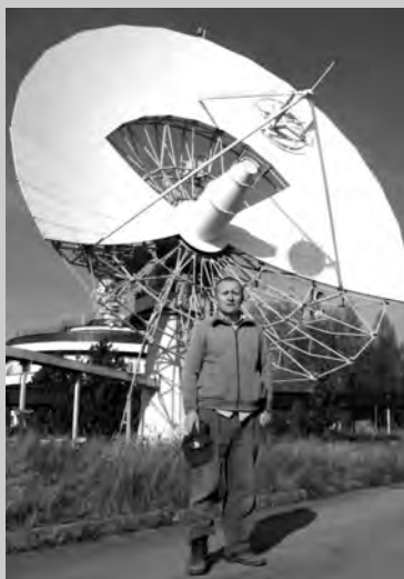
Radioteleskop z Psar

a) na potrzeby dyskoteki – rejestracja silnych kosmicznych sygnałów radiowych i ich implementacja do utworów muzycznych, odtwarzanych podczas dyskoteki,