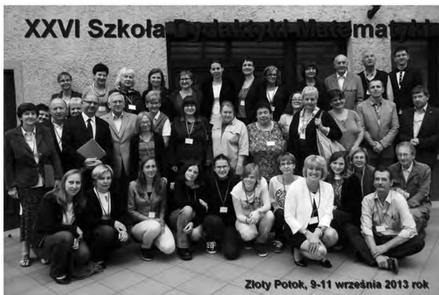
Uczestnicy konferencji na pamie³kowej fotografii

Drugi wyk³ad plenarny wyg³osi³ prof. Ryszard Pawlak. W streszczeniu referatu zatytu³owanego „Mechanizmy