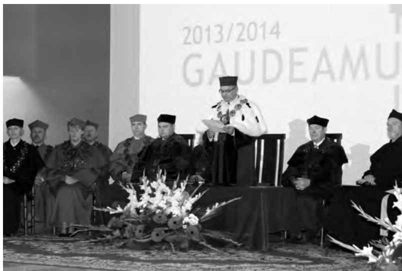
W 3 adze AJD w trakcie inauguracji, fot.: arch.

Nie brakuje projektów, które naszym studentom, a póŹniej absolwentom maj 1 daæ lepszy start na rynku pracy. Jedn 1 z wdro¿onych ostatnio idei jest ksztac 3 enie studentów na kierunku praca socjalna. Wydzia 3 Pedagogiczny AJD ma byæ prekursorem na skalê ogólnopolsk 1 przedsiêwziêcia polegaj 1 cego na ksztac 3 eniu dualnym: praktyczno-teoretycznym. Polega ono na tym, ¿e nasi studenci, dziêki podpisanym porozumieniom, bêd 1 zatrudniani ju¿ w trakcie studiów u potencjalnego pracodawcy, a dodatkowo otrzymaj 1 dyplom ukoñczenia presti¿owej uczelni – Federalnego Urzêdu Pracy Niemiec. Podziêkowania za pomoc nale¿ 1 siê tutaj