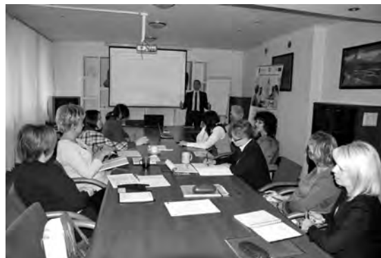
Podczas szkolenia

wraz z systemami informatycznymi umożliwiającymi ich praktyczne zastosowanie oraz konkretnymi rozwiązaniami przyjętymi przez wiodące organizacje. Uczestnicy powinni opanować całość materiału w ciągu dwóch semestrów studiów.