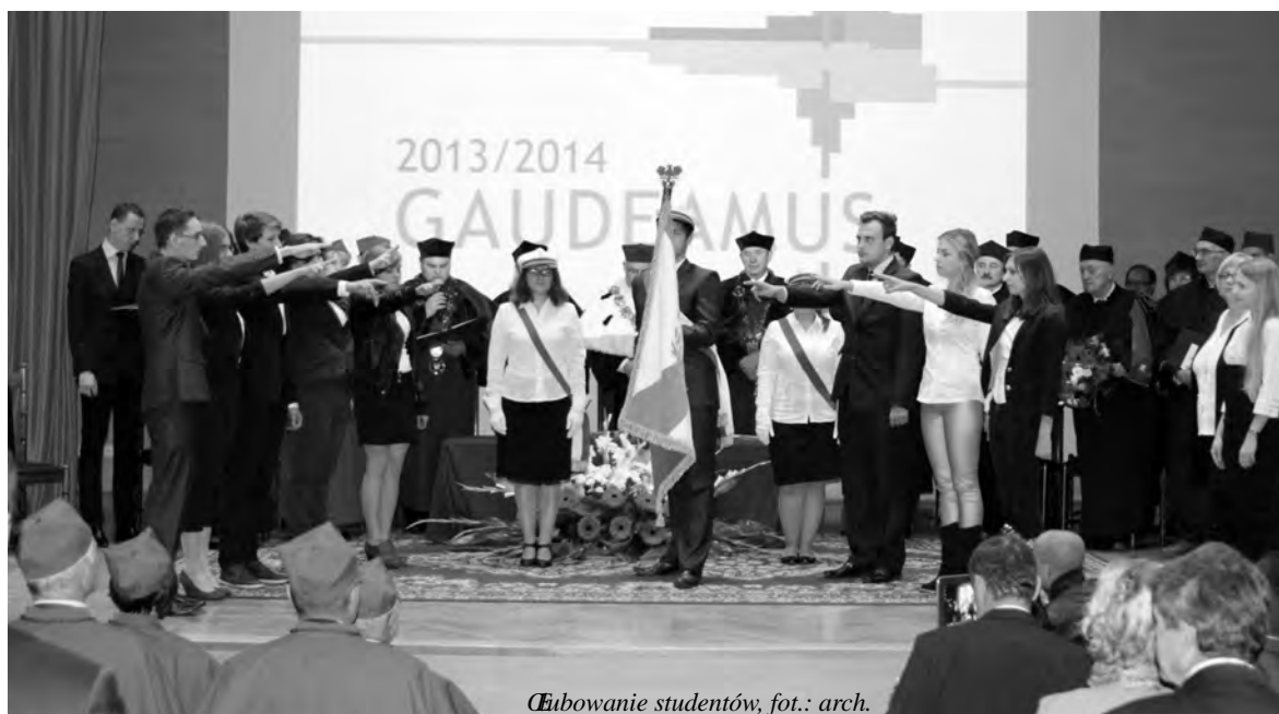
Witowanie studentów

W dniu inauguracji najlepsze życzenia kierują do wszystkich pracowników naszej Akademii. Życzę dalszego rozwoju na polu badań naukowych oraz w dydaktyce. O wydajną pracę na rzecz Akademii proszę wszystkich pracowników zatrudnionych w Uczelni oraz identyfikujących się z nią. Najlepsze życzenia kierują pod adresem naszych Przyjaciół, którzy licznie zaszczycili nas swą obecnością w czasie dzisiejszej Inauguracji. Za Państwa pośrednictwem składam życzenia nauczycielom i uczelniom szkół regionu częstochowskiego, instytucjom, zakładom pracy, stowarzyszeniom i innym jednostkom, które Państwo reprezentujecie.