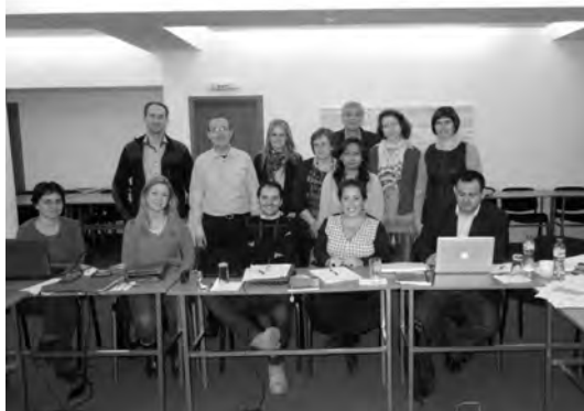
Uczestnicy spotkania

W ramach zadania 5 ( Testing and quality increase ), którego realizacja właśnie się rozpoczyna, mamy zamiar zaoferować Wirtualny kurs „Senior education: A Quality of Life approach to assessing educational institutions”. Twórcą kursu jest Uniwersytet Jaume I z Hiszpanii we współpracy z AJD. Rejestracja trwa do 26 maja. Szczegóły na stronie projektu: www.edusenior.uj.edu.pl .