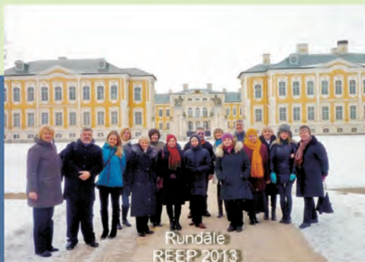
Rundāle REEP 2013