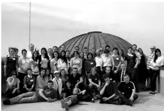
Uczestnicy konferencji