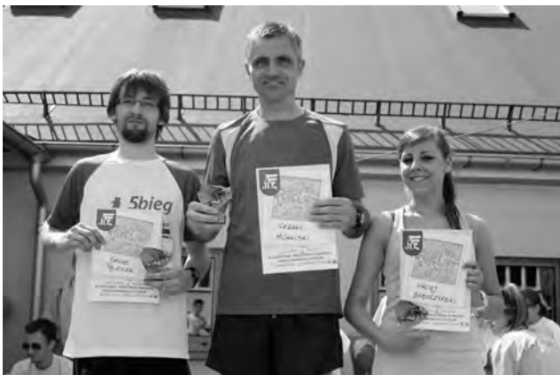
Nagrodzeni uczestnicy biegu

Dzi 3 eki pomocy w 3 adz AJD, Samorz 1 dowi Studenckiemu AJD oraz wysi 3 kom organizator 3 ów odby 3 a si 3 e najwi 3 eksza impreza biegowa, która wpisze si 3 e na sta 3 e w kalendarz uczelnianych wydarze 3 Ź. Wysi 3 ek oraz starania ludzi zaangażowanych w ten bieg nie posz 3 y na marne, gdy 3 impreza pokaza 3 a, Źe studenci AJD, a w zw 3 aszcza WF-ic 3 i kochaj 1 sport oraz maj 1 zadatki na wy 3 omienionych organizator 3 ów du 3 ych imprez sportowych.