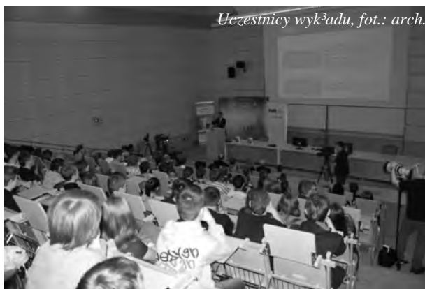
Uczestnicy wykładu

O książce sporo można znaleźć w Wikipedii: