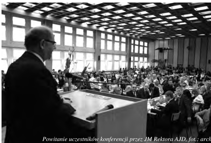
Powitanie uczestników konferencji przez JM Rektora AJD