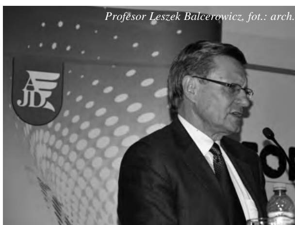
Profesor Leszek Balcerowicz

Powodem wizyty była przede wszystkim promocja książki zatytułowanej „Odkrywajcie wolność. Przeciw zniewoleniu umysłów”. To unikalny zbiór 50 dzieł klasyków myśli wolnościowej od Adama Smitha przez Milтона Friedmana aż po Leszka Koźłakowskiego. Wyboru tekstów dokonał Leszek Balcerowicz, który jest również autorem wstępu do książki.