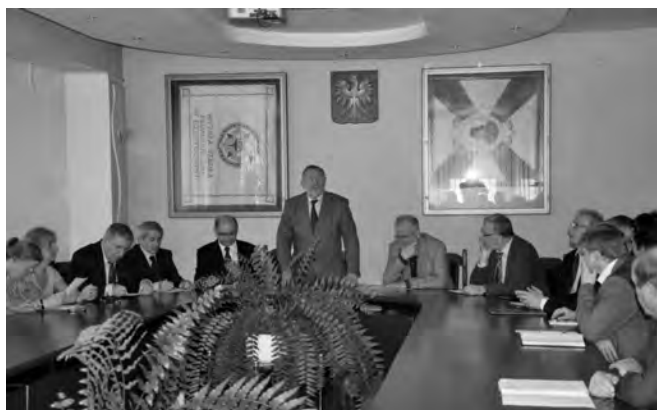
„Narada Długoszowska”

Dzień później uczestnicy narady na zaproszenie burmistrza Kłobucka i Ponadregionalnego Stowarzyszenia Edukacyjnego „Wieniawa” spotkali się w tym mieście, biorąc udział w Zjeździe Przedstawicieli Federacji Miejsc Długos-