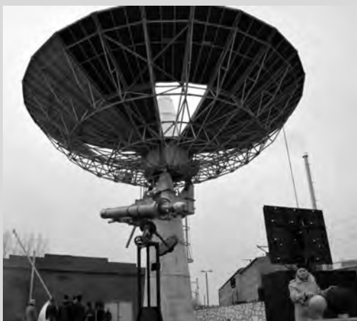
Bez nim badać kosmos