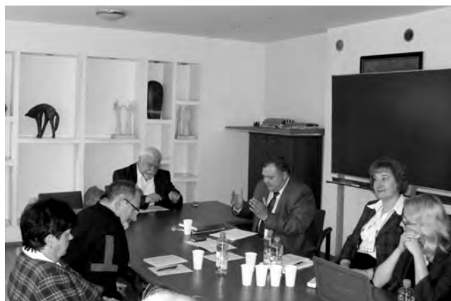
Uczestnicy III sekcji konferencji