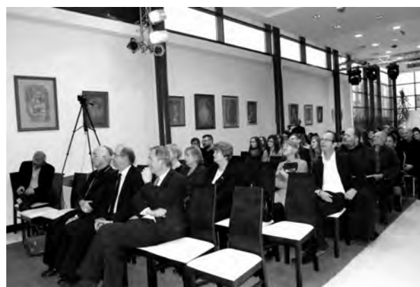
Uczestnicy konferencji „Koniec œwiata i co dalej?”

Z jednej strony trwa nieustaj¹cy dyskurs o charakterze kosmologiczno-astronomicznym proponuj¹cy coraz to inne scenariusze „ostatecznego rozwi¹zania” œwiata, z drugiej zaœ³ychaæ g³osy profetów wieszcz¹cych o koñcu rozumu, nauki, poznania, cywilizacji, kultury, cz³owieka, œmierci sztuki, filozofii, historii, autora, ca³oci... Tym samym zagadnienie krañcowoœci wpisuje siê w antropologiczny topos koñca œwiata, rozumiany jako pewnego typu konstrukcja my³owa, idea, ukazuj¹ca cz³owieka i jego rzeczywistoœæ w perspektywie celu, kierunku, w którym zmierza on sam, ale i historia, kultura, cywilizacja. To nieustanne mierzenie siê