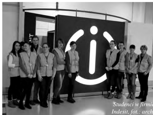
Studenci w firmie Indesit

Studenci, przyglądając się poszczególnym procesom dowiadywali się o sposobach kontroli jakości na poszczególnych stanowiskach oraz o rozwiązaniach komunikacyjnych w ramach poszczególnych komórek. Poza szczegółową wizytę w hali produkcyjnej, program obejmował również zwiedzanie magazynu wyrobów gotowych. Oprowadzenie po rozległej hali magazynowej oraz omówienie przez pracownika Indesitu zachodzących tam procesów i działań wywarło na studentach duże wrażenie: – Bardzo cieszę się