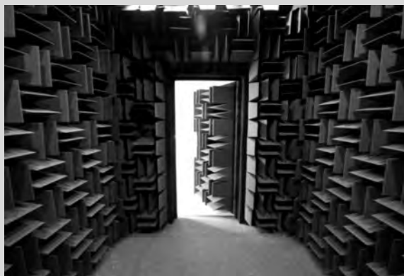
Komora robi wrażenie, fot.: MM

W budynku mieszczącym Instytut Fizyki AJD przy al. Armii Krajowej 13/15 powstało unikatowe laboratorium służące studentom specjalności akustyka i realizacja dźwięku. W skład laboratorium wchodzi dwa pomieszczenia. Pierwsze z nich to komora pogłosowa. Podłoga w tym pomieszczeniu celowo pokryta płytkami ceramicznymi, a ściany do wysokości sufitu pomalowano specjalną farbą odbijającą fale dźwiękowe. Dzięki takim zabiegom w pomieszczeniu uzyskano duży czas pogłosu. Drugie pomieszczenie to komora bezechowa, której ściany i sufit zostały pokryte materiałem dźwiękochłonnym (kliny akustyczne), a podłoga została wyłożona specjalnie wykładziną pochłaniającą fale akustyczne. Dzięki takiej adaptacji akustycznej czas pogłosu w komorze wynosi 9 ms. Czasy pogłosu obu pomieszczeń zostały zmierzone przez zewnętrzny firmę, zgodnie z obowiązującymi normami. Instytut Fizyki posiada certyfikaty pomiarowe dla ww. pomieszczeń. Pracownia powstała dzięki współpracy fizyków z częstochowską firmą APAMA.