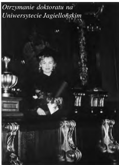
Otrzymanie doktoratu na Uniwersytecie Jagiellońskim

są zapraszani do udziału w tym Międzynarodowym Festiwalu Literackim - jednym z najbardziej prestiżowych wydarzeń literackich na świecie. Co ciekawe, w 2011 r. została przetłumaczona na język polski książka napisana w całości przez szkocką autorkę książek w której jest wiele o Polakach (tytuł: „Niedźwiedź Wojtek. Niezwykły bohater Armii Andersa”). Książka ta przypomina skomplikowane dzieje pewnej niezwykle przyjaźni ludzi ze zwierzęciem (Wojtek, ów syryjski niedźwiedź brunatny dożył dwudziestu dwóch lat w Zoo w Edynburgu).