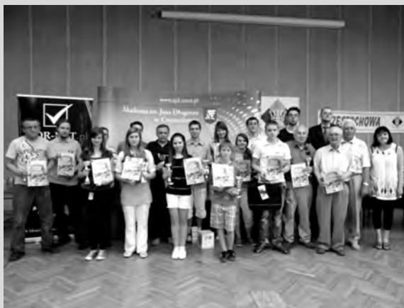
Uczestnicy turnieju