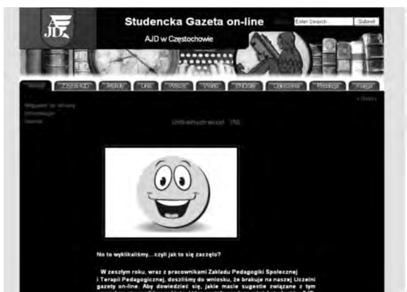
Wygląd gazetki on-line