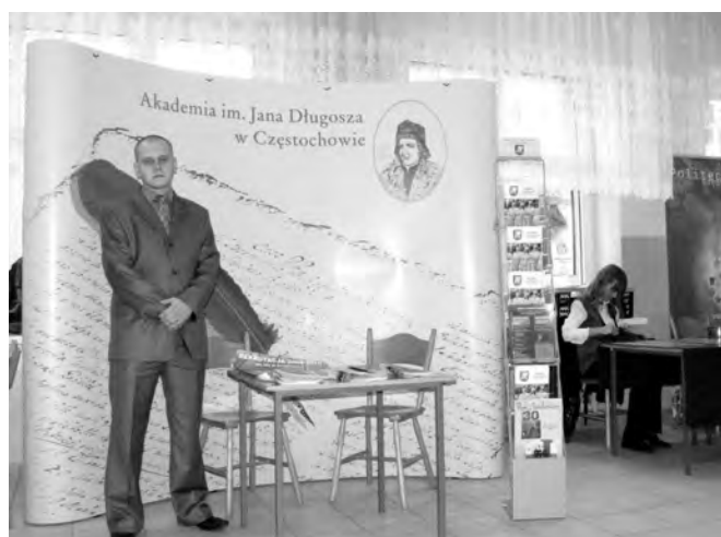
Targi w Radomsku