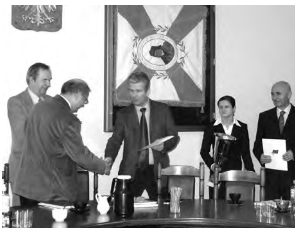
Przekazanie pucharu zdobytego przez zawodniczki AJD