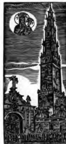
Jasna Góra w zbiorach Biblioteki Głównej AJD

BIBLIOTEKA GŁÓWNA AKADEMII IM. JANA DŁUGOSZA W CZĘSTOCHOWIE