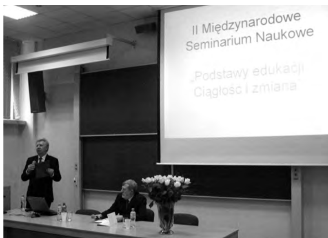
Otwarcie seminarium

Kolejną osobą, która miała okazję zaprezentować się na seminarium była prof. Beata Gofron, która zauważyła m.in. to, iż zasady neoliberalnego, wolnego rynku wkraczają na pole oświaty skutkując nierównością edukacyjną. Do tematu