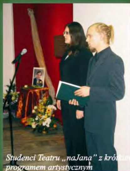
Studenci Teatru „na Jana” z krótkim programem artystycznym