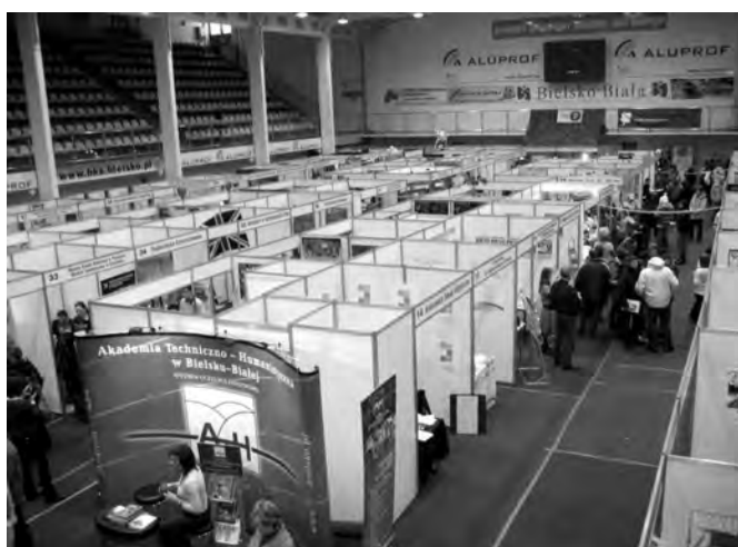
Targi w Bielsku-Białej